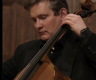
本·罗格森 大提琴演奏家 19:00 - 20:30