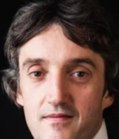
安东尼·休伊特 钢琴演奏家 19:00 - 20:30